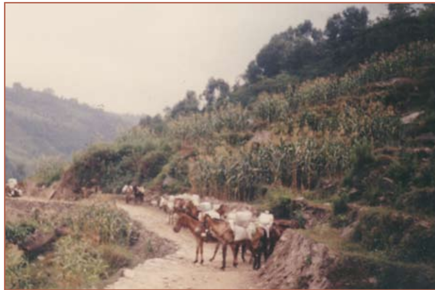
घोडेढो बाटोमा खच्चरहरू